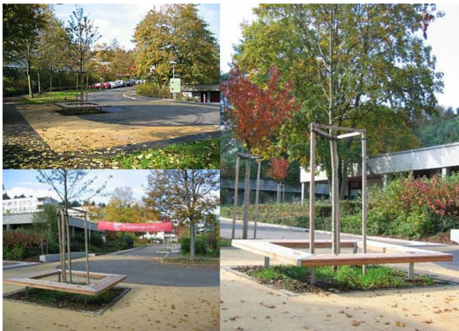
Baugenossenschaft Hagenbrünneli, Lerchenberg, Zürich

Das Modell ist übertragbar auf andere "autogerechte" Siedlungen und Wohnquartiere. Durch die Umgestaltung wird das Auto nicht aus dem Wohnumfeld verbannt – die Parkieranlagen sind nach wie vor komfortabel anzufahren – aber die Strassenräume sind viel angenehmer und sicherer für Velos und namentlich für FussgängerInnen.