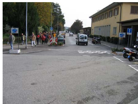
Grenchen, Bahnhof Süd