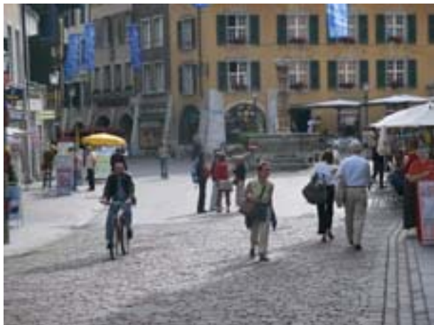
Begegnungszone Altstadt Solothurn

Seit dem 24. April 2006 ist die gesamte Altstadt Solothurns als Begegnungszone signalisiert. Je nach Tageszeit gelten jedoch nach wie vor Zufahrts- oder Durchfahrtsbeschränkungen. Die Begegnungszone hat sich als Instrument zur Förderung von belebten und attraktiven Innenstädten ausserordentlich bewährt. Im Fall der Begegnungszone Altstadt Solothurn wurden die zahlreichen Anliegen der verschiedenen Interessengruppen erfolgreich in ein einziges Konzept integriert.