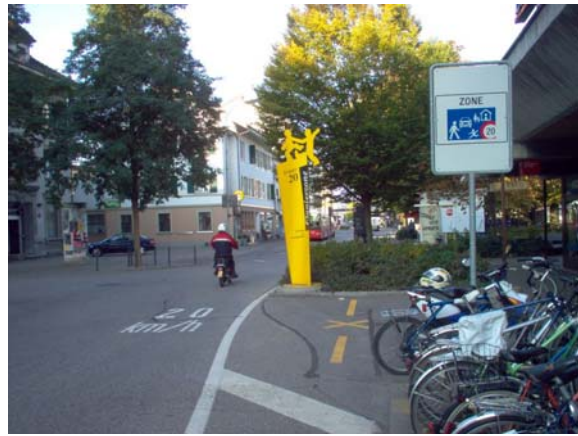
Eingang Begegnungszone, Poststrasse