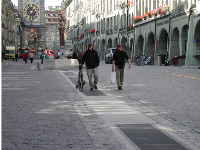
Kramgasse, Bern